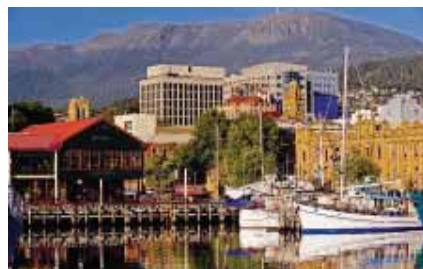
Capitale de la Tasmanie, Hobart est un port actif qui possède un charmant quartier de cottages du XIX e siècle.

emprunte l'accueil chaleureux au B & B et le confort aux hôtels de charme. Cette maison victorienne mélange antiquités et design ultramoderne, notamment dans les salles de bains. On se relaxe dans le petit salon ou le verger, tous deux délicieux. Neuf chambres et suites à partir de 160 €. ■ A. R.