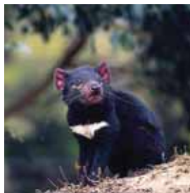
Le diable de Tasmanie ou sarcophile (qui aime la viande) n'existe plus que dans l'île australienne.

A Hobart, la capitale, leur art s'expose dans les galeries hype. Port d'attache d'autres aventures (Freycinet, le mont Field, la péninsule de Tasman...), on y flâne en tongs au marché baba cool de Salamanca, dans le coquet quartier des cottages 1850. Et l'on refait l'Overland Track le samedi soir, dans un pub où s'empresment des jeunes filles en minirobes satinées. ■